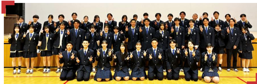
令和8年度 生徒会役員一同